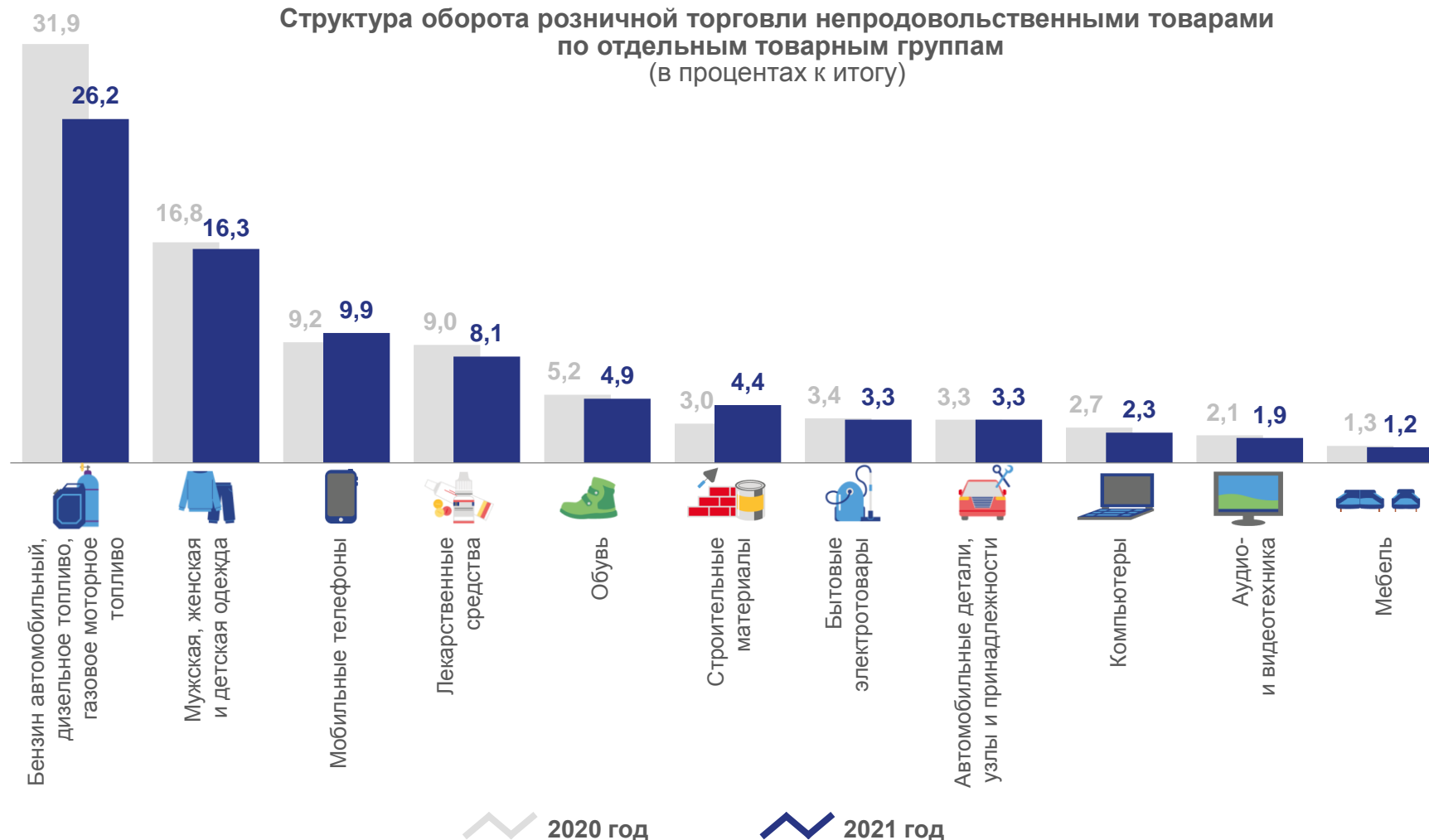
Структура оборота розничной торговли непродовольственными товарами по отдельным товарным группам (в процентах к итогу)